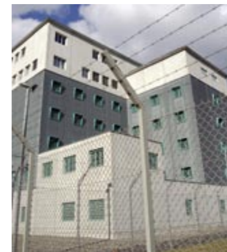
Das SRK betreut auch Insassen des Ausschaffungsgefängnisses in Zürich-Kloten